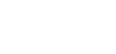
R.S. van Belzen Griffier

Aldus vastgesteld in de openbare Raadsvergadering van donderdag 28 april 2016